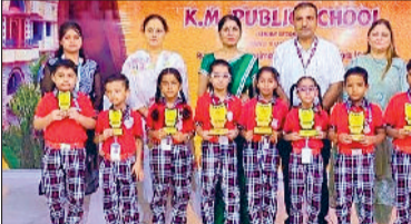
मिवाणी। प्रतियोगिता में बेहतरीन प्रदर्शन करने वाले शिक्षकों के साथ प्रतिभागी।