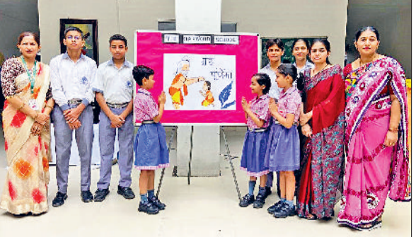
भिवानी। गुरु का पूजन करते बच्चे।

कोट रोड स्थित दक्षिण काली नवदुर्गा मंदिर में गुरु पूर्णिमा पर्व पर भव्य धार्मिक कार्यक्रम का आयोजन किया। अलखुबल से ही श्रद्धालुओं का तांता मंदिर में लगना शुरू हो गया और पूरा परिवार माता रानी के जयकारों से गूंज उठा। इस दिन पर जिन भक्तों की मन्तनं पूरी हुई, वे श्रद्धालु अपने घरों से ध्वजा (धार्मिक झंडा/ढमाला) लेकर पहुंचे और मां काली के चरणों में श्रद्धा से अर्पित किया। ढोल-मगाड़ों और भक्ति गीतों की गूंज ने माहौल को दिव्य बना दिया। माता रानी के