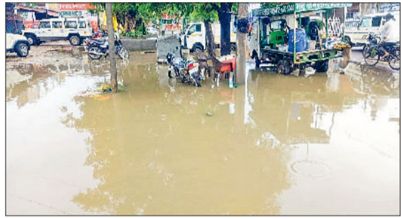
भिवानी। बवानीखेड़ा की रिहायशी बस्ती में जमा बारिश का पानी और बाजार में जमा बरसात का पानी।

सुबह जब लोग सोकर उठे तो उस वक्त धीमी गति से हवा चल रही थी। थोड़ी देर बाद सूर्यदेव के दर्शन हुए और आसमान साफ हो गया। कुछ देर बाद फिर से हवा ने