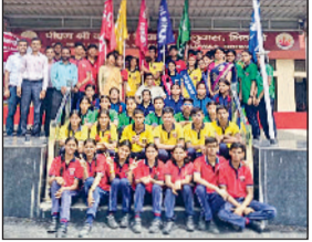
मिवाणी। प्राचार्य के साथ छात्र परिषद के सदस्य।