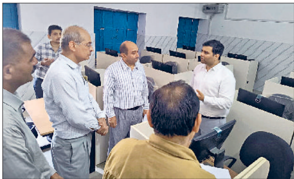
भिवानी। स्कूल में जिला शिक्षा अधिकारी से सुविधाओं की जानकारी लेते ओएसडी।