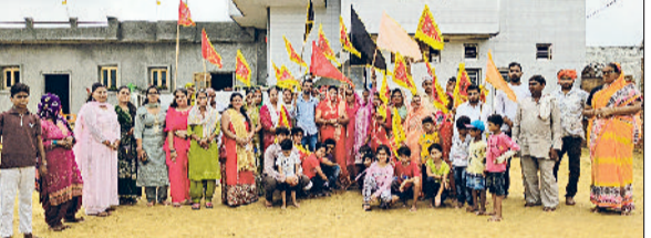
भिवानी। दक्षिण काली नवदुर्गा मंदिर में ध्वजा लेकर जयकारे लगाते श्रद्धालु।

जाने जाते हैं जिन्होंने भारतीय संस्कृति, साहित्य और दर्शन में अभूतपूर्व योगदान दिया है। अतः आज का दिन हमें सिखाता है कि अपने गुरु के प्रति सदैव आदर, आभार और विनम्र रहना चाहिए। यह दिन हमें हमें संदेश देता है कि यदि हम अपने आचार्यगण के बताए हुए मार्ग पर चलते हैं तो जीवन में सफलता, सम्मान व सुख प्राप्त कर सकते हैं। उन्होंने बताया कि कार्यक्रम का मुख्य उद्देश्य गुरु शिष्य परंपरा के महत्व को भावी पीढ़ी में संस्कार के रूप में स्थापित करना रहा। पुरान समय में हमारे देश में अनेक गुरुकुल रहे है, जिनमें श्रेष्ठ गुरु अपने शिष्यों को विभिन्न प्रकार की विधाओं में परीत करते रहे हैं। यह परंपरा अब विलुप्त हो चुकी है कार्यक्रम में अनेक विद्यार्थियों ने अपनी कविताओं व भाषण के माध्यम से गुरु के महत्व पर प्रकाश डाला।